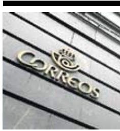
Sede de Correos.